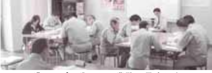
グループに分かれて業務の見直しを