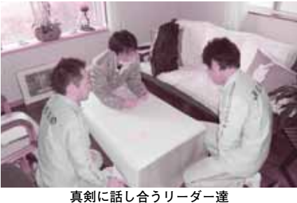
真剣に話し合うリーダー達