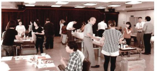
今後も継続的に開催。お気軽にご参加ください！

会議所と会員の皆さま、地元事業者同士が接点をもつことのできる場となることを目的に開催！