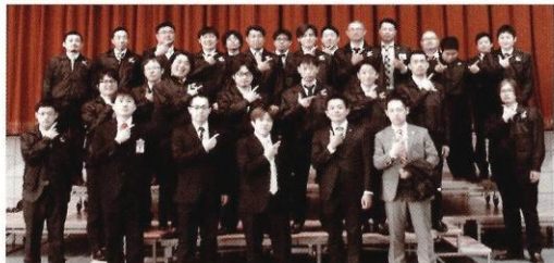
年齢18歳～45歳の幅広い世代でネットワークが構築できます！

次代を担う青年経済人としての資質の向上と事業所の発展を図り、豊かな地域経済社会を築くことを目的に活動中！