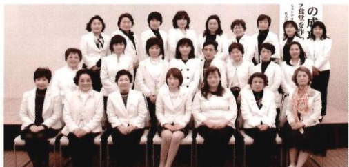
会員事業所の役員や家族、従業員の方ならご加入いただけます！

会員相互の親睦を密にし、女性としての資質向上と商工業の振興を図ることを目的として活動中！